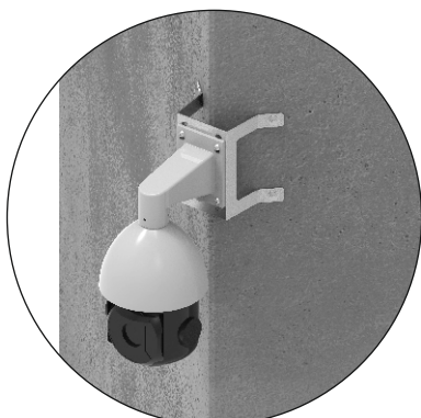
- przykład montażu kamery przemysłowej do narożnika ściany za pomocą uchwytu UN