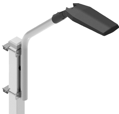
Przykład zastosowania wieszaka W03

- stal ocynkowana ogniowo zg. z PN-EN ISO 1461:2011