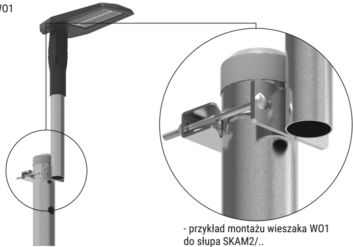
- przykład montażu wieszaka W01 do słupa SKAM2/..