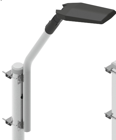
Przykład zastosowania wieszaka W02 i W03

- stal ocynkowana ogniowo zg. z PN-EN ISO 1461:2011